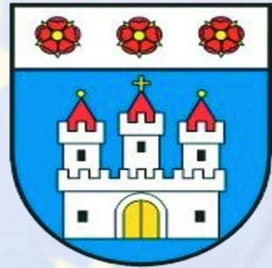
Nowy Dwór Gdański