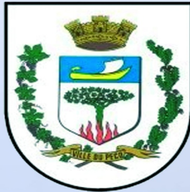
Le Pecq Sur Seine